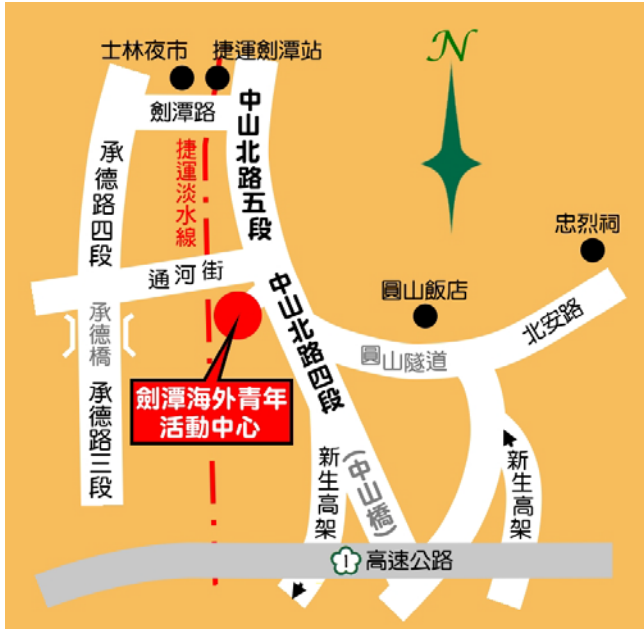
劍潭海外青年活動中心園區平面圖